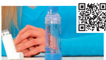
Aerochamber Plus Flow-VU® mit Mundstück (Erwachsene)