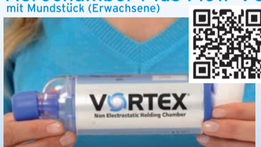
VORTEX® antistatische Inhalierhilfe mit Mundstück