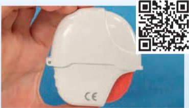
Tiotropium Glenmark Inhaler