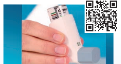
Dosieraerosol mit Zählwerk