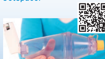
Inhalierhilfe zerostat VT