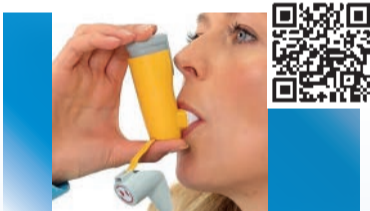
Aerosphere Inhalator (neu Mai 2022)