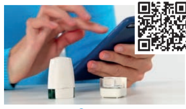
Breezhaler® mit Sensor und App